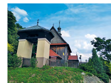
Kościół pw. św. Mikołaja w Czulicach

Muzeum znajduje się w miejscu, gdzie dawniej stał dom, w którym urodził się i mieszkał Adam Chmielowski – św. Brat Albert. Nowoczesna ekspozycja przybliża postać i dzieło świętego. Większość zgromadzonych pamiątek i mebli pochodzi z połowy XIX w.