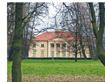
Pałac Wodzickich w Igołomi

Klasycyzyczny pałac wybudowany na przełomie XVIII i XIX w. jest dziełem architekta Chrystiana Piotra Aignera. Jest to piętrowa budowla na planie prostokątnym z ozdobnym czterokolumnowym portykiem, umiejscowiona w otoczeniu zabytkowego parku z aleją dojazdową. Do 1939 r. pałac wielokrotnie zmieniał właścicieli. Obecnie jest w użytkowaniu Pracowni Archeologicznej Instytutu Archeologii i Etnologii Polskiej Akademii Nauk.