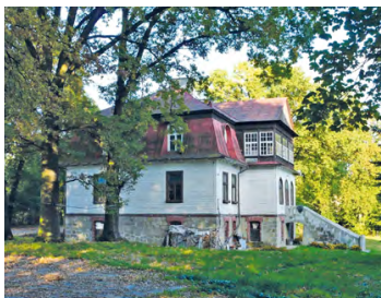
Dwór w Konarach

Na zespół składają się: dwór, dozorówka, spichlerz, obora i park. Uwagę przyciąga zwłaszcza budynek dworski wzniesiony w latach 20. XX w. Jest to przykład tzw. stylu dworskowego. Właścicielami majątku byli kolejno rodzina Grabowskich, a następnie Felicja Malinowska.