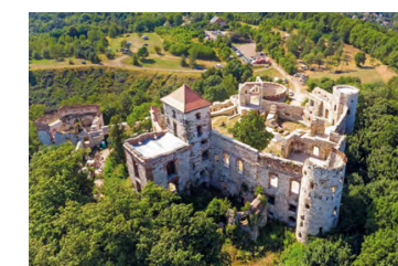
Zamek Tenczyn w Rudnie

Leśny rezerwat (95,94 ha) obejmujący fragment doliny potoku Rudno, porośnięty zróżnicowanymi zbiorowiskami leśnymi, w tym łągiem olszowym. W obrębie rezerwatu znajduje się nieczynny kamieniołom „Orlej”.