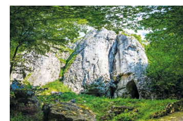
Jaskinia Wierchowska Górna

W Jaskini Wierchowskiej znajduje się najdłuższa trasa turystyczna spośród wszystkich jaskiń w Polsce! Do przejścia jest ok. 700 m, podczas gdy długość całego labiryntu to 1000 m. Ściany i strop pokrywa bogata szata naciekowa. Zwiedzanie jaskini odbywa się z przewodnikiem, na oświetlonej trasie.