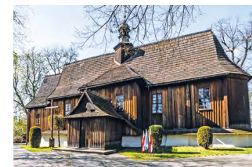
Kościół w Modnicy

Warto tu zobaczyć drewniany kościół z 1553 r. z muraowaną wczesnobarokową kaplicą z 1662 r. Wewnątrz zachowały się renesansowe polichromie oraz bogate wyposażenie z XVII/XVIII w. Po przeciwnej stronie drogi stoi klasycystyczny dwór Konopków z 1784 r., przebudowany w 1813 r., otoczony rozległym parkiem. Dwór należy do Uniwersytetu Jagiellońskiego