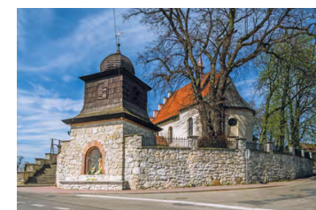
Kościół w Giebułtowie, fot. Tomasz Trulka

Kościół pochodzi z lat 1601–1604, wewnątrz znajdują się polichromie z XVII w., płyty nagrobne: gotycka Oracowskich z poł. XV w. oraz renesansowa.