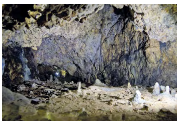
Jaskinia Nietoperzowa

To jedna z większych jaskiń na Jurze, ma ponad 300 m długości. Swą nazwę zawdzięcza licznie występującym tu nietoperzom. Słynie z odnalezionych w niej kości zwierząt z okresu zlodowaceń. Jaskinia wyróżnia się piękną szatą naciekową. Kręcono w niej sceny do filmu „Ogień i mieczem” Jerzego Hoffmana. Jest udostępniona dla turystów od kwietnia do listopada. Zwiedzanie na oświetlonej trasie odbywa się z przewodnikiem. Trwa ok. 30 min. Obok działa Matpi Gaj z tyrolką i wspinaczką skałkową.