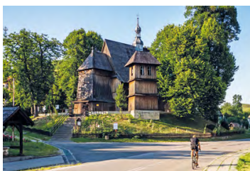
Kościół w Raclawicach

Drewniany kościół pochodzi z 1511 r. Jest to świątynia w stylu późnogotyckim, która bez większych zmian przetrwała do naszych czasów. Jedynie na przetomie XVII i XVIII w. dobudowano do niej wieżę. We wnętrzu uwagę zwracają gotyckie detale, renesansowa polichromia z XVII w., rzeźba Matki Boskiej z Dzieciątkiem z XV w.