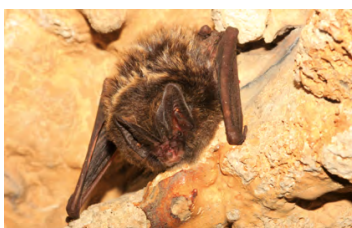
Mopek, fot. Bogusław Czerwiński