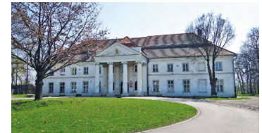
Pałac Wodzickich w Niedźwiedziu, fot. © Radosław Dybała

Okazaly klasycystyczny pałac powstał na przełomie XVII i XVIII w., początkowo stanowił siedzibę rodziny Małachowskich. Po nabytcu przez Stanisława Wodzickiego rezydencję przebudowano. Obecnie jest siedzibą szkoły.