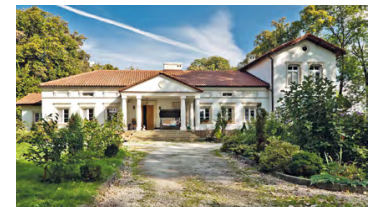
Zespół dworski w Goszczy, fot. © Piotrekwas

Odrestaurowany parterowy dwór z kolumnowym portykiem i dobudowanym później skrzydłem pochodzi z połowy XIX w. W czasie powstania styczniowego w 1863 r. stanowił siedzibę sztabu generała Mariana Langiewicza. Obecnie budynek jest własnością prywatną.