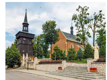
Kościół w Raciborowicach