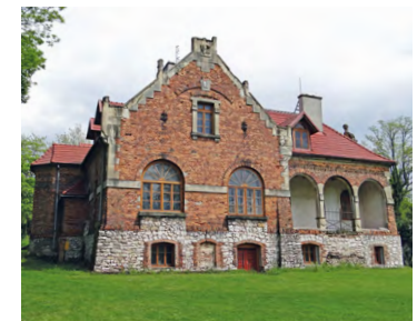
Dwór Dąbrowskich w Michałowicach

W skład zespołu dworskiego wchodzi: dwór, ruiny spichlerza, stajnia oraz park romantyczny. Dwór w stylu malowniczo-historyzmu wybudowano w latach 1892–1897. Był świadkiem wielu historycznych wydarzeń. W 1914 r. przechodziła tędy Pierwsza Kompania Kadrowa Józefa Piłsudskiego. W czasie I wojny światowej dwór pełnił rolę szpitala wojskowego. Po pożarze w 1979 r. został odbudowany przez obecnych właścicieli.